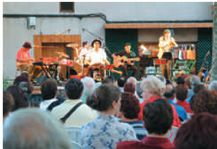
Concert de Quico el Cèlio, el Noi i el Mut de Ferreries a la plaça Macià.

(El preu per a cada concert de cançó d'autor és de 6 euros a la venda anticipada i 8 euros a taquilla. Els quatre concerts es faran a l'envelat de Vil·la Flora.)