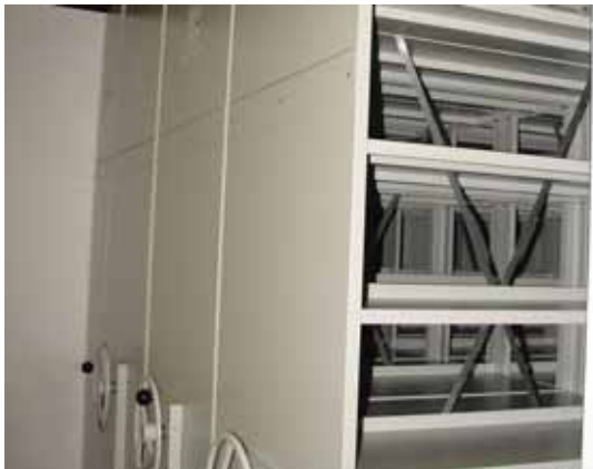
Dipòsit de compactes de l'Arxiu Municipal

E l Ple de l'Ajuntament ha aprovat el Pla Local d'Equipaments Culturals (PLEC) i ho ha fet d'acord amb el que estableix el PECCat 2009 -2019, el Pla d'Equipaments Culturals de Catalunya, redactat per la Generalitat i que té per objectiu dotar el territori català d'una xarxa d'equipaments culturals bàsics.