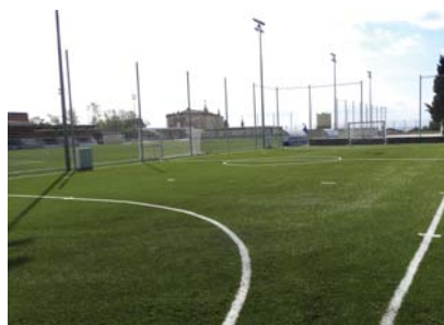
Vista des del camp d'entrenament