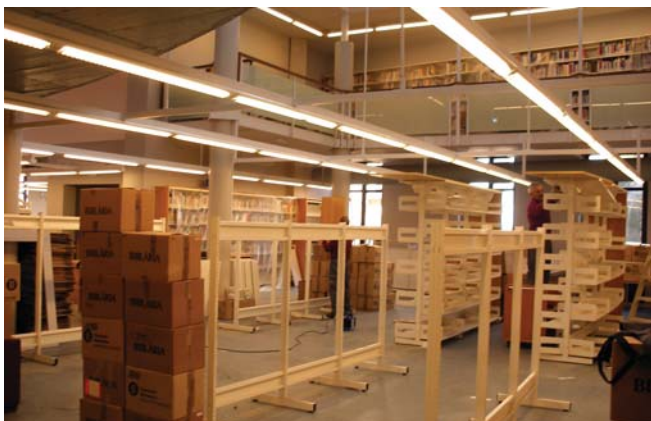
La sala gran al novembre

Les portes obertes han comptat amb un espectacle d'animació i amb activitats per a petits i grans