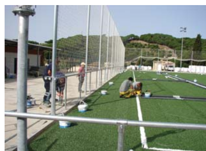
Col·locació de la gespa