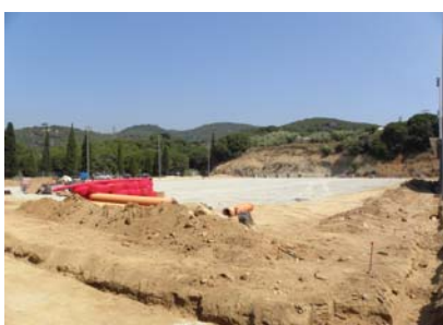
Primers treballs. Juliol 2010