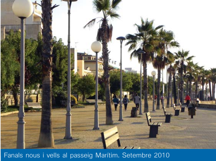
Fanals nous i vells al passeig Marítim. Setembre 2010

A mb el FEOSL, el Fons estatal per a l'ocupació i la sostenibilitat local, hem pogut renovar completament l'enllumenat del passeig Marítim. També ha estat possible millorar energèticament els carrers següents: riera Pinar, avinguda Marià Serra, carrers Canigó, St. Cristòfol, Verge del Pilar, Rosselló, Sta. Bàrbara, València, Ravalet, St. Pau i trams dels carrers Pas d'en Marges, Mas Feliu, Miseri-