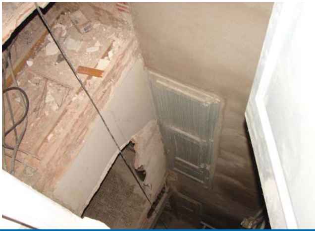
Forat de la plataforma elevadora de Vil·la Flora

T res dependències de l'Ajuntament estan d'obres aquestes dates. L'edifici del carrer Ample, Vil·la Flora i La Masoveria. Al primer encara no han començat els treballs, tot i que ja s'ha fet la neteja dels espais. Vil·la Flora i La Masoveria pateixen de ple els efectes de la instal·lació de les plataformes elevadores que faran possible l'accés a les dependències a les persones que tenen mobilitat reduïda.