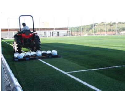
Omplint el camp de cautxú