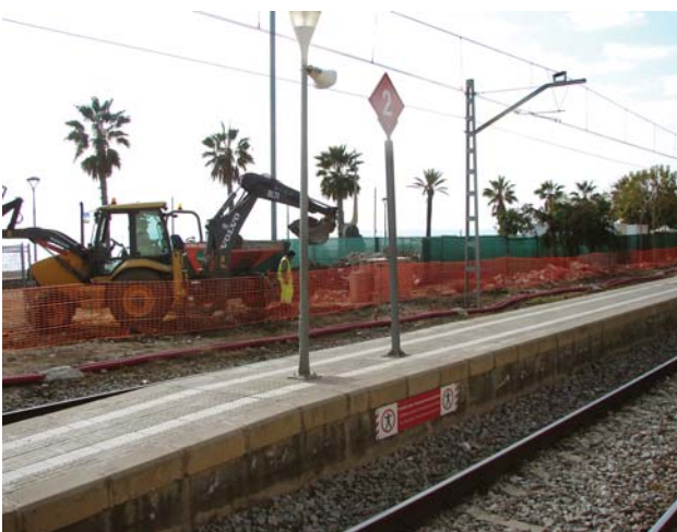
Primers treballs de la remodelació de l'estació de RENFE. Desembre 2010