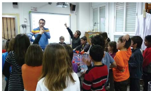
Alumnes del CEIP Misericòrdia

E ntre les moltes activitats que fan els estudiants de Canet, aquesta tardor ens ha arribat informació de dues iniciatives que han fet, d'una banda els estudiants de l'Institut Lluís Domènech i de l'altra, els alumnes de l'Escola Misericòrdia.