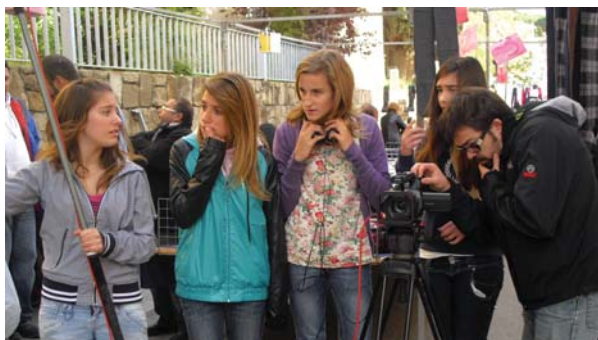
Alumnes de l'institut