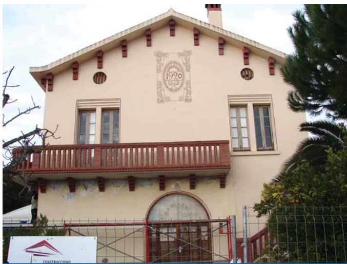
Les obres refan completament la balconada de l'equipament

Mentre no s'acaben les obres, sobretot les que afecten l'interior de les sales de La Masoveria, la dinamitzadora juvenil que està treballant aquests mesos per l'Àrea de Joventut, centra la seva tasca a les activitats exteriors, com ara l'obertura, de nou, de la pista d'skate.