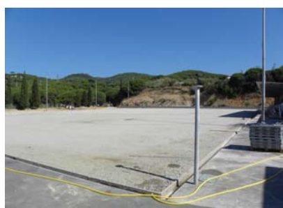
Les obres. Agost 2010