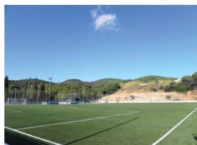
L'obra acabada. Novembre 2010