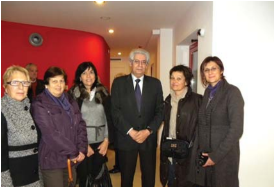
Els Garrofers amb l'Associació Amics del Ball

E l centre residencial Els Garrofers està enllestit el procés d'adquisició de l'equipament i el mobiliari de totes les dependències que ocuparan els residents.