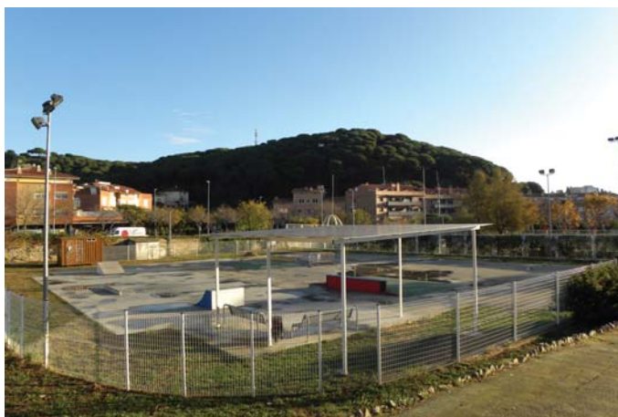
La dinamització juvenil se centra ara en la pista d'skate