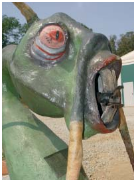
A la Tamborinada enverinada aquestes bèsties escopiran confetti en comptes de foc

Un cop hàgim gaudit d'aquesta tarda de màgia, la Tamborinada ens conduirà fins a la V actuació castellera amb els Capgrossos de Mataró que tindrà lloc a la plaça de la Llenya, a les 8 del vespre.