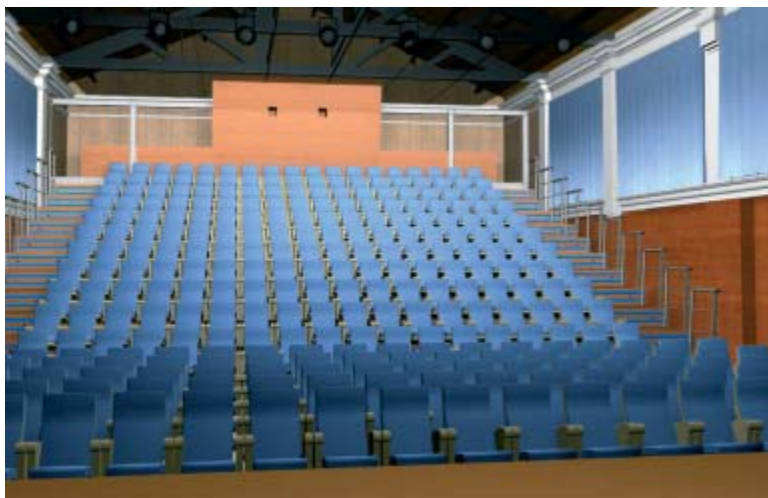
Imatges 3D del projecte del teatre municipal