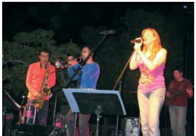
Concert de l'Orquestra Gira-Sol