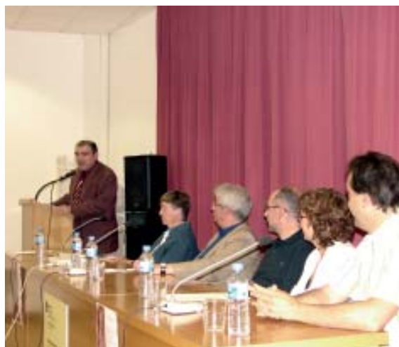
L'acte va aplegar un centenar de persones a l'Escola de Teixits