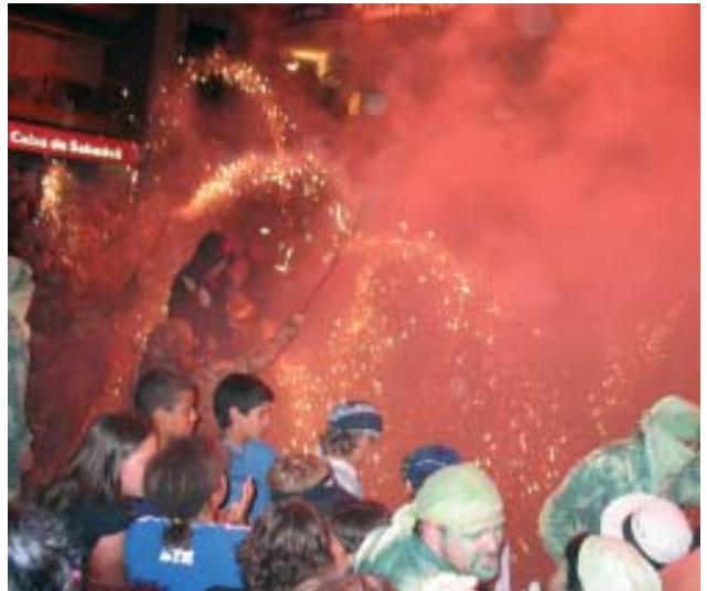
Passejada de foc de la Nit Màgica

Quan acabi la Nit Màgica començarà, al passeig Marítim, la Nit Jove amb el concert de la Gira-sol, que posa punt i final a quatre dies de jam sessions, disc-jockeys, concerts de rock, barraques... i concursos originals, com ara el de trencar síndries amb el cap o el llançament de tasses de wàter.