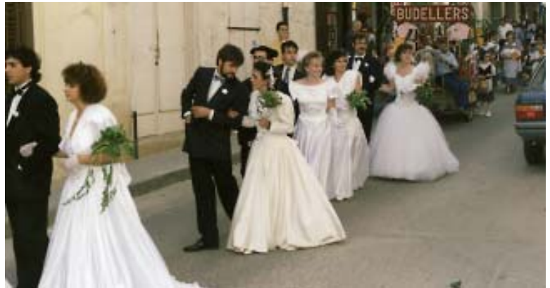
Quinaires de l'any 90 fent la passada

Heu de saber que aquests que truquen a casa vostra, són parelles del poble acabades de casar. Aquest 2006, n'hi ha 4, dues casades l'any 2004 i dues l'any 2005. Els diners que recullen són perquè retornin al poble en forma de celebració. Aquest 2006, amb una festa el 28 de juliol i activitats infantils durant aquell cap de setmana. De moment, ja porten recollits més de 4.000 euros.