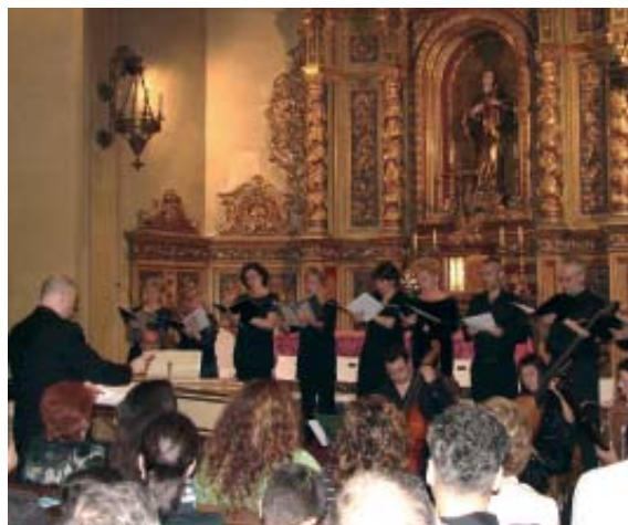
El concert formava part del cicle Primavera de les Arts 2006