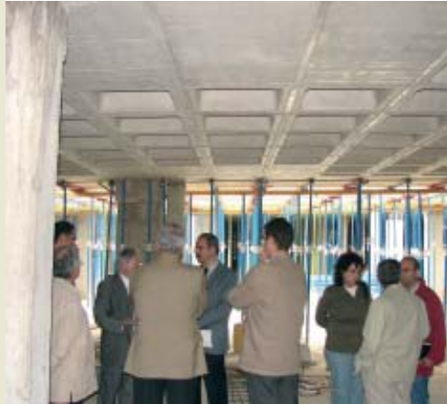
Maig 2006. Visita d'obres

en tot el procés de cessió dels terrenys a l'Ajuntament i l'elaboració del projecte d'aparcament, plaça i centre d'assistència primària al centre de poble.