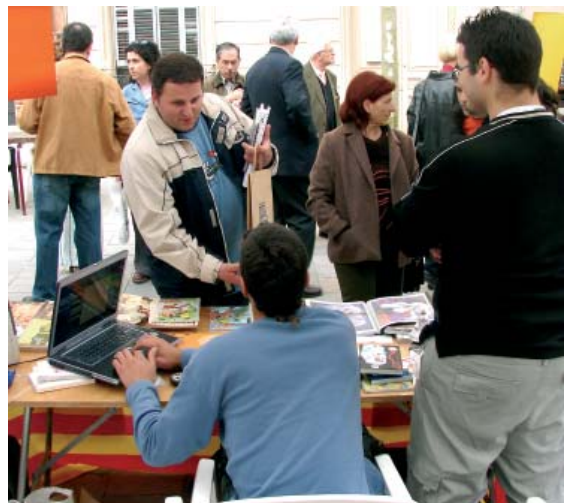
A la mostra d'entitats han participat una dotzena de grups de joves

Entre els projectes més immediats d'aquest equipament hi figuren l'organització de tardes d'orientació per a joves sobre els temes que més els poden interessar i l'ampliació d'informació de l'equipament a través d'internet.