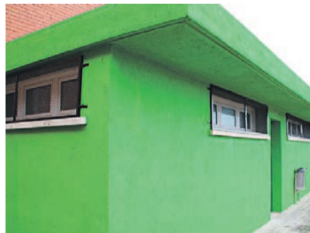
Agricultura ecològica per a dos joves de Canet

En aquesta 1a edició del Jove Activa't hi participen 12 joves. Les primeres feines, les han fetes a l'Escola Misericòrdia