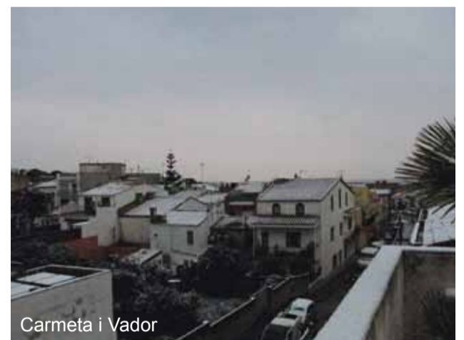
Carmeta i Vador