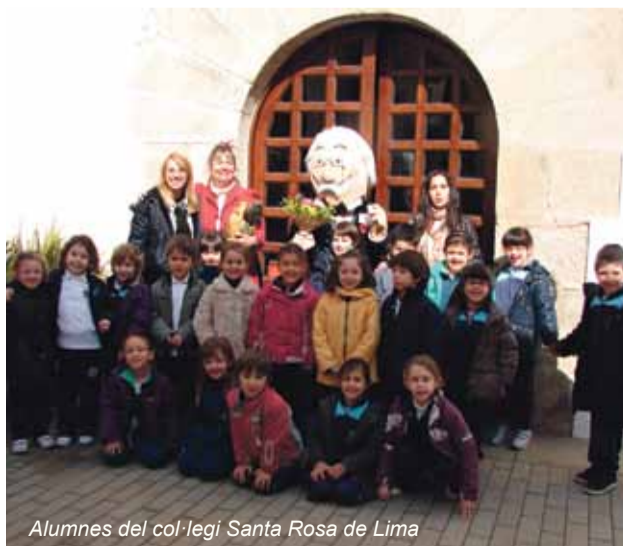
Alumnes del col·legi Santa Rosa de Lima

A part de fer ruta pels carrers i edificis del centre de Canet, els alumnes participen en uns tallers que es fan a la sala jardí, i que inclouen manualitats amb sucre, cafè, cotó i cacau, els principals aliments i materials que els indians comercialitzaren a Canet. A Canet sempre els hem conegut com a americanos , més que no pas indians , com se'ls ha batejat en altres poblacions.