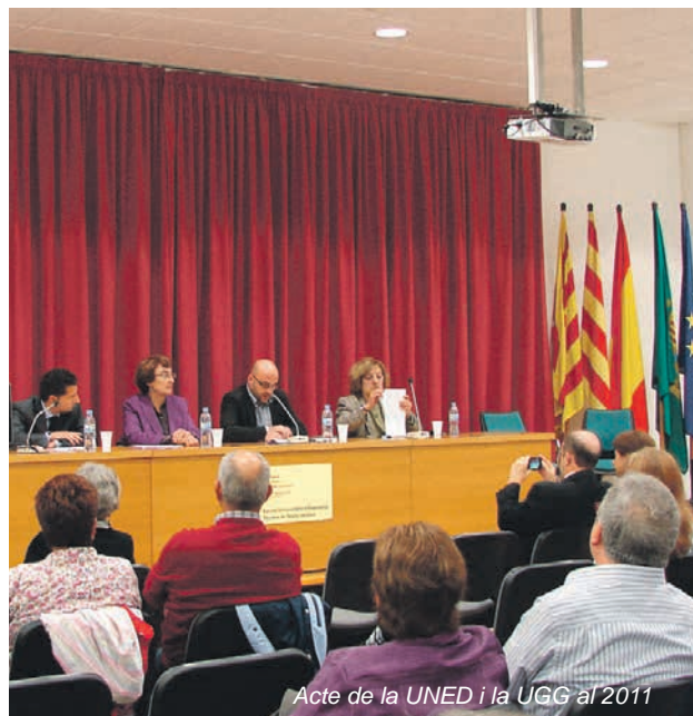
Acte de la UNED i la UGG al 2011

La UGG, per la seva banda, ha augmentat el nombre de matrícules. Aquest curs 2012 - 2013 hi ha hagut 110 matrícules, tenint en compte que un mateix alumne es pot inscriure a diferents assignatures. La mitjana és de 18 persones per assignatura o taller.