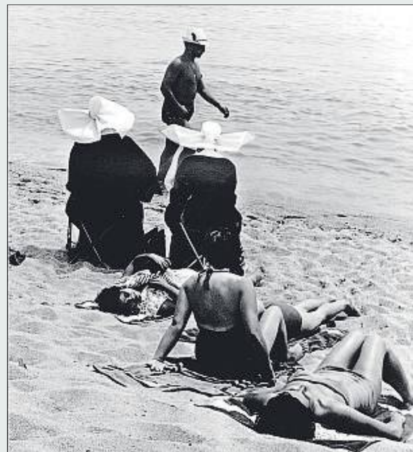
Sorpresa inaudita (1961), foto que no va agradar al bisbe Modrego