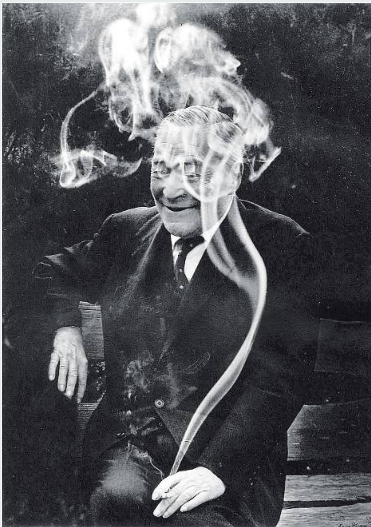
Josep Pla envoltat del fum de la seva cigarreta, en una fotografia del 1967