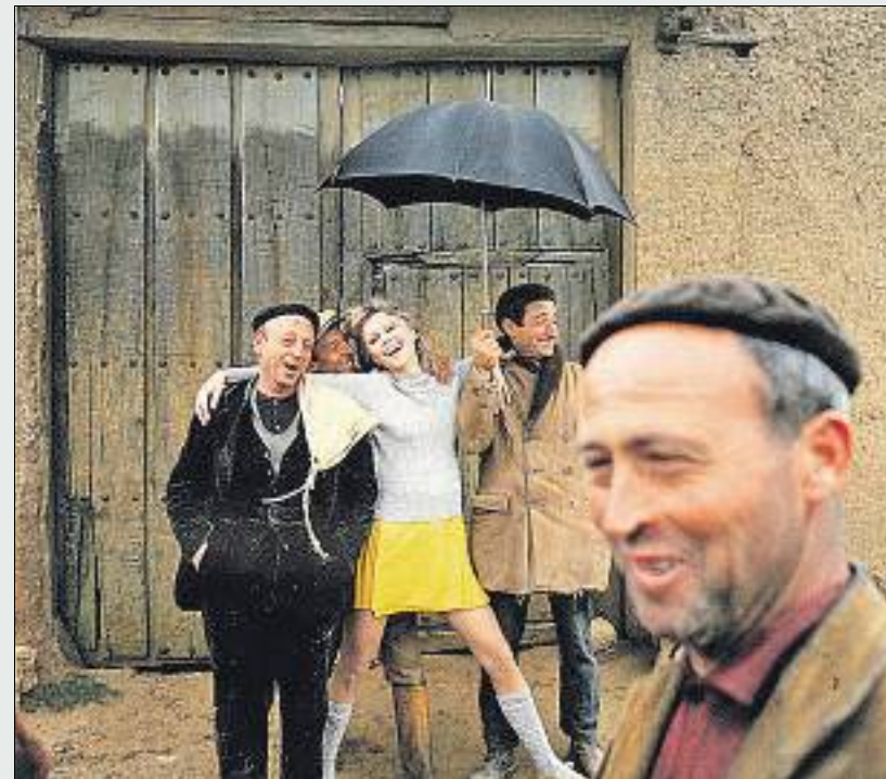
S'ha trencat la calma en un poble de Lleó (foto publicitària del 1968)