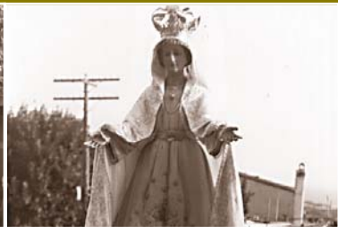
Els gegants, els capgrossos i la momerota davant el Santuari - Processó pel passeig, l'any 1942 - La nova imatge de la Misericòrdia entrant al Santuari