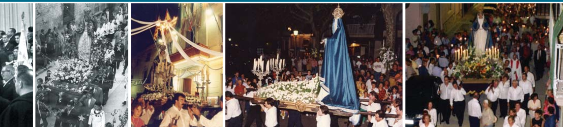
Processó pel carrer Ample. - Processó de la Mare de Déu, en motiu del 50è aniversari de la nova imatge, l'any 1992 - Processó de la Mare de Déu, l'any 2003