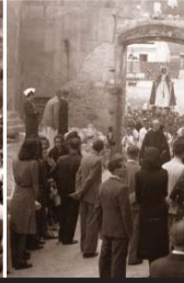
Imatge de la Mare de Déu de la Misericòrdia - Arribada en barca i acompanyada dels pescadors de can Peix, l'any 1942 - Arribada a la platja davant u