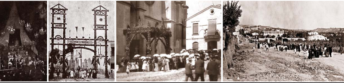
rdia, el 1907 - Arc de triomf aixecat i costejat per Josep Dotras, l'any 1907 - Benedicció de la campana del Santuari, el 1908 - Romiatge de l'any 1916

1913 ELS ROMIATGES Les primeres dècades del segle XX són un moment culminant en la devoció a la Misericòrdia. La gent del Maresme visita la Misericòrdia. La gent del Maresme es casen a la Misericòrdia. Els romiatges són multitudinaris i freqüents. Esmentarem el pelegrinatge franciscà del 1913. (Hi ha una placa commemorativa a la façana de l'església parroquial.) El peregrinatge del 1915, per demanar la pau d'Europa, presidit pel Cardenal Netto, Patricarca de Lisboa. Podem anotar altres romeries de parròquies de Barcelona, Mataró, Badalona i de tot el Maresme (Les cròniques de l'historiador badaloní Josep Maria Cuyas Tolosa expliquen una romeria presidida pel Pare Claret, anys després St. Antoni Maria Claret). En el transcurs d'aquests romiatges populars de ben segur que tothom demanava la seva conveniència. Es diu que els camperols resaven baixet: "Pluja i collites", els pescadors: "Sol i sèpies", el grup de fabricants (era l'època que els hi anava bé a les fàbriques amb la gran guerra europea): "Pluja o sol i guerra a Sebastopol". Al marge d'aquesta llicència de bon humor la Mare de Déu segur que lliurava infinites, múltiples petites gràcies a uns i a altres. La galeria d'exvots ens dóna un anònim i discret testimoniatge.