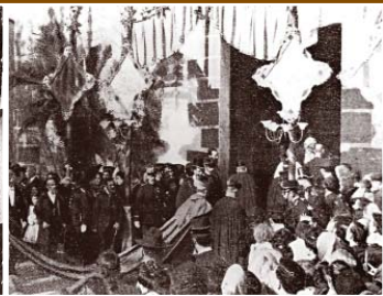
Fris del Santuari amb les obres de la Misericòrdia, de 1880 · Festes, actes i processó en motiu de la Coronació Canònica de la Mare de Déu de la Misericòrdia