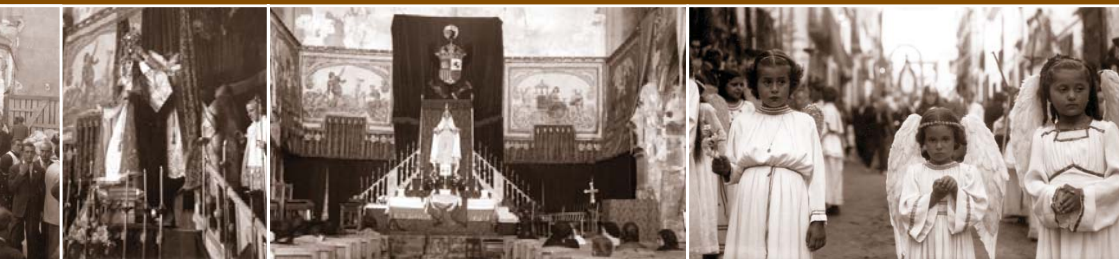
na gran multitud - Entrada a l'església parroquial, l'any 1942 - Coronació de la Verge - Altar a la Verge a l'església parroquial - Processó de l'any 1942