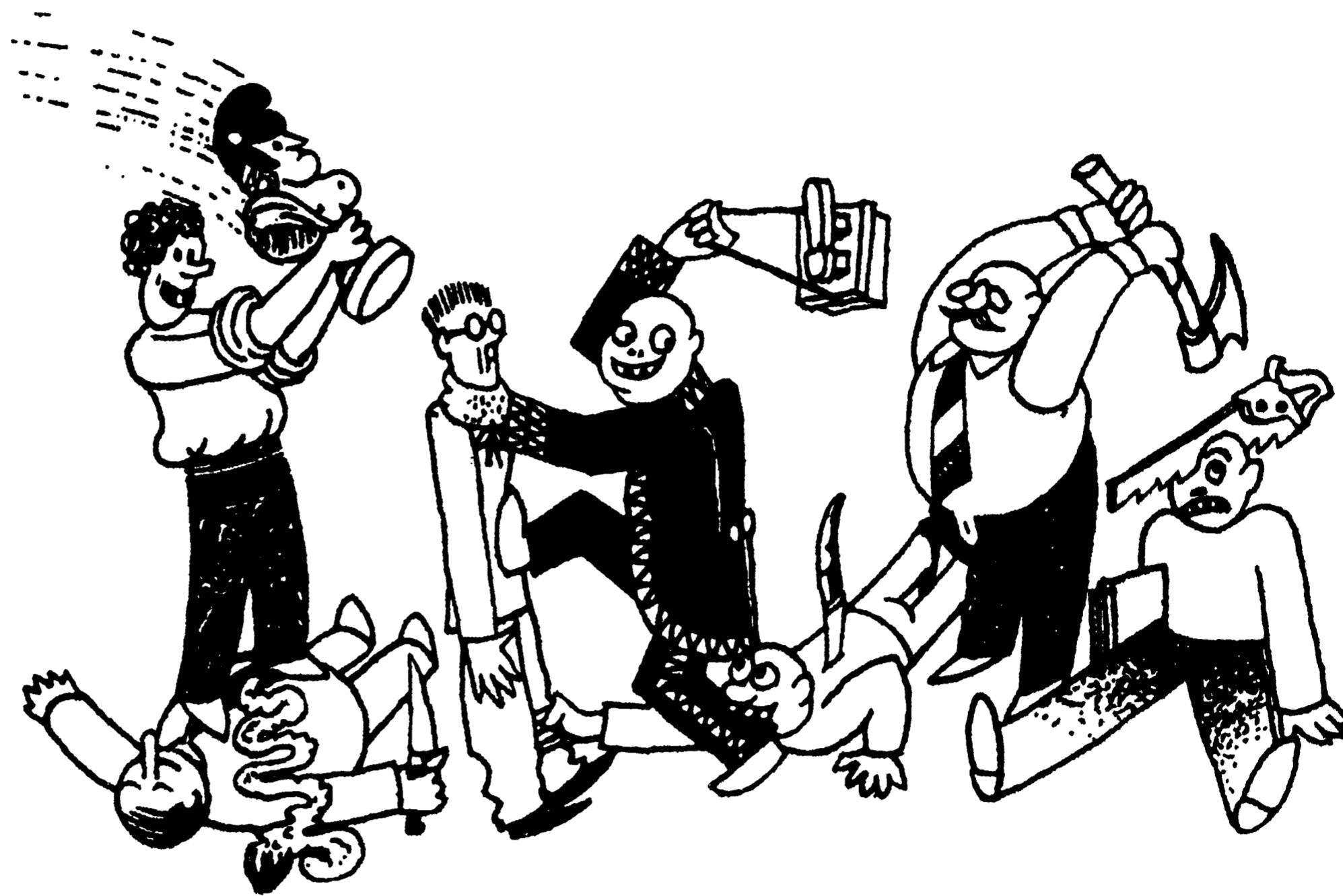
El Consell de Ministres, en la intimitat