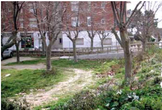
Plaça de la ronda Anselm Clavé, abans i després de les obres

Aquests últims quatre anys, Canet de Mar ha organitzat dues escoles taller amb l'objectiu de poder tirar endavant obres i serveis diversos d'utilitat pública i d'interès social que ha permès a les persones que hi han participat de fer un treball efectiu, a l'hora que han rebut formació professional que els ha servit, d'aquesta manera, per facilitar-los la inserció laboral.