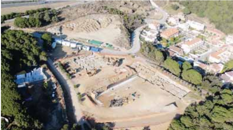
Les obres de la segona escola al gener de 2007

L'Ajuntament, d'acord amb el Departament d'Educació ha posat en marxa aquest mes de març, un servei d'informació i assessorament per a totes aquelles famílies que estiguin interessades en la segona escola. En concret es vol assessorar sobre: els equipaments de què disposarà el nou centre, el procés de preinscripció i matriculació, la formació de l'AMPA, els serveis i extraescolars que oferirà l'escola, el transport escolar, etc.