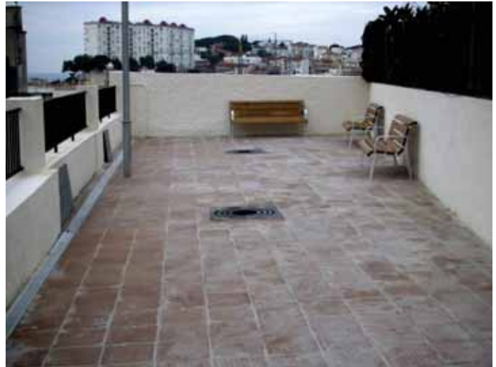
Plaça del davant del Plat de i Cullera, abans i després de les obres

Un cop aquestes escoles taller arriben a la fi dels dos anys, els alumnes compten amb una borsa de treball i dels contactes que la mateixa escola els proporciona, per poder aconseguir la inserció laboral. L'última escola, Els Aromers, va aconseguir una inserció laboral del 70%, la majoria dels alumnes en l'ofici que havien après durant aquells dos anys.