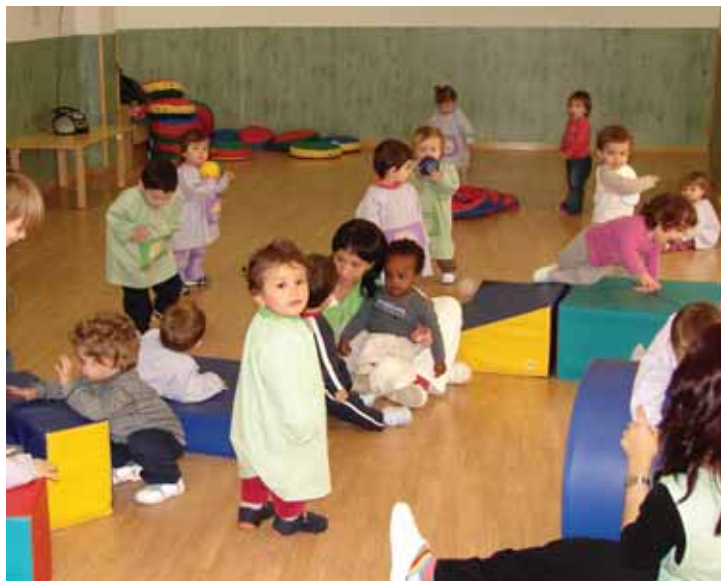
Nens i nenes del Palauet del curs 2005-2006

El període de matriculació serà del 4 al 8 de juny.