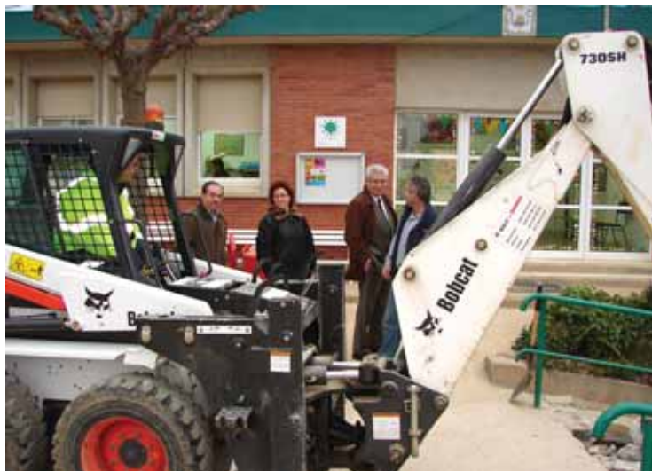
Visita a les obres de l'Escola Misericòrdia

de l'Ajuntament ha aconseguit el compromís de signar un conveni per a 150.000 euros amb el Departament d'Educació de la Generalitat de Catalunya, precisament per fer més obres de millora i reforma en aquesta escola.