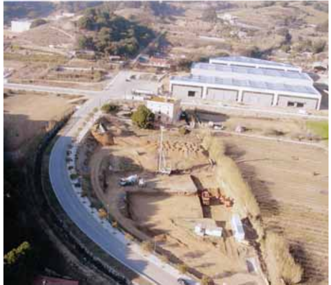
Les obres, al gener de 2007

En el Ple municipal de fa un any, doncs, va aprovar l'estudi de viabilitat i l'inici de l'expedient de contractació per construir una piscina coberta i un gimnàs al municipi. Després de fer una presentació del projecte a la població, a finals de l'any passat, van començar les obres d'aquest equipament. Amb un pressupost de 4.000.000 d'euros, les obres per construir, a la futura zona esportiva, a tocar del polígon industrial Can Misser, la piscina municipal, van a bon ritme i és previst que s'acabin a termini. La piscina ha estat una demanda social des de fa molts anys. Ara, gràcies a l'esforç municipal a l'hora de cercar inversors privats i subvencions de les administracions, s'ha pogut tirar endavant i la primavera de l'any que ve ja en podrem gaudir tots.