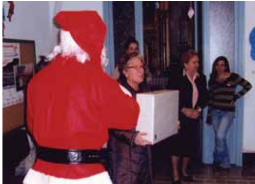
Visita institucional a l'associació Terra i Cel. Nadal 2006

El solar té més de 5.000 metres quadrats i s'hi construirà un edifici residencial que tindrà una capacitat per a 44 places. A més a més, hi haurà 10 places exclusives per a centre de dia. L'estructura espacial correspon a un edifici que tindrà quatre unitats de convivència. En aquestes unitats hi haurà habitacions, menjador, cuina, sala d'estar, aules, despatxos, una infermeria, lavabos adaptats i serveis adients a les necessitats d'aquestes persones.