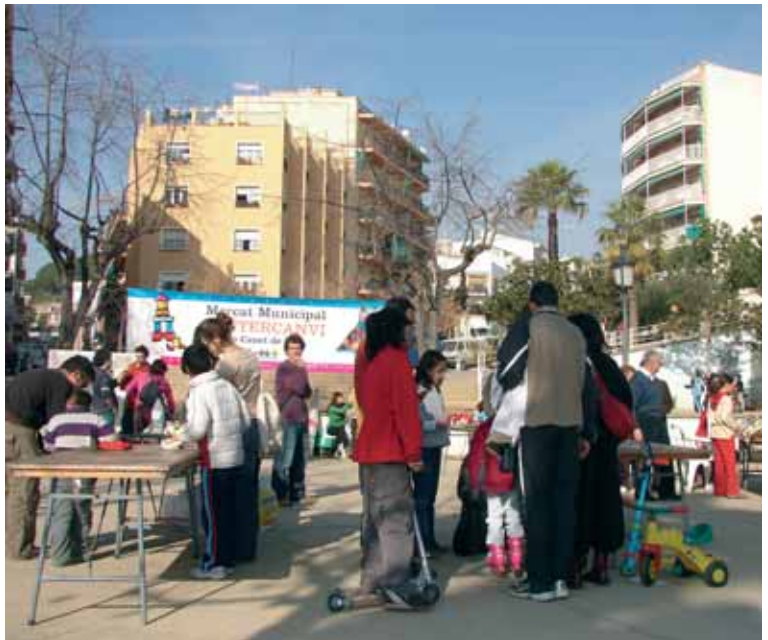
El Mercat d'Intercanvi es fa cada tercer de dissabte de mes al matí, a la plaça Onze de Setembre

El Mercat d'Intercanvi és una de les novetats del 2006. Un espai virtual sempre a través d'internet i presencial cada tercer dissabte de mes en el qual podeu canviar allò que no us serveix, però que pot anar bé a algú altre.