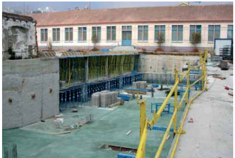
L'aparcament al centre, ara fa un any

L'edifici d'equipaments esportius i l'hotel d'entitats serà una realitat la primavera de l'any 2008