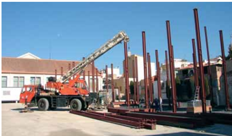
Obres del futur Centre d'Atenció Primària

També s'ha aconseguit altres fites en altres espais del poble. L'any 2006 ha estat, finalment, el d'inici de les obres de la segona escola, tant necessària i reivindicada per la