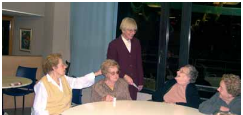
Amb la gent de l'Esplai