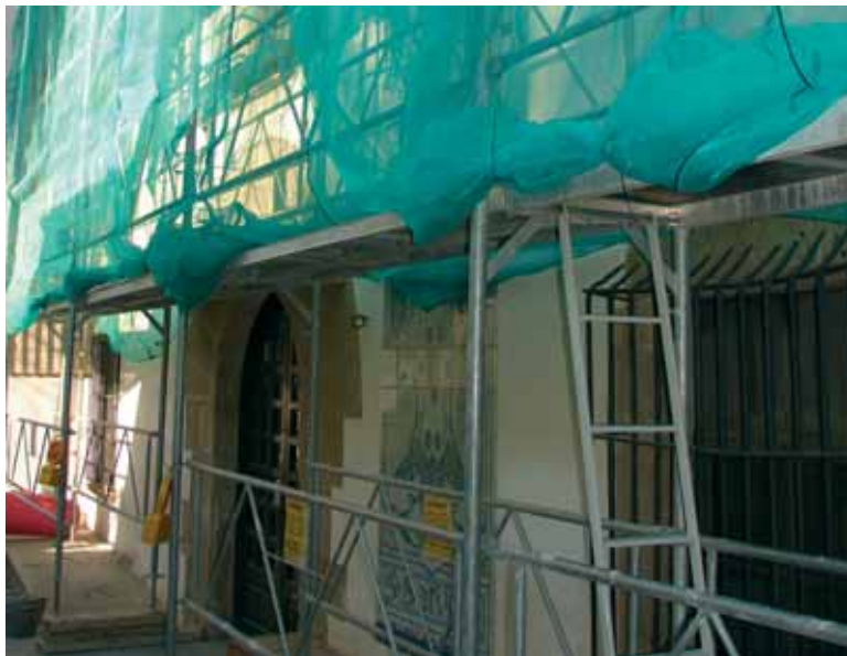
Obres de rehabilitació de la masia Rocosa

Al 2006 ha estrenat tribuna. La restauració ha costat 170.000 euros i els ha pagat íntegrament la Diputació de Barcelona. I aquests dies podem veure com s'està treballant en una nova teulada per a la Masia Rocosa. A més a més de les visites guiades i les exposicions que gairebé ininterrompudament podem trobar-hi, la Casa museu ha col.laborat al 2006 amb el Centre de Recursos Pedagògics, l'IES Lluís Domènech, l'Arxiu municipal i la Biblioteca en la preparació d'un crèdit de síntesi sobre el modernisme.