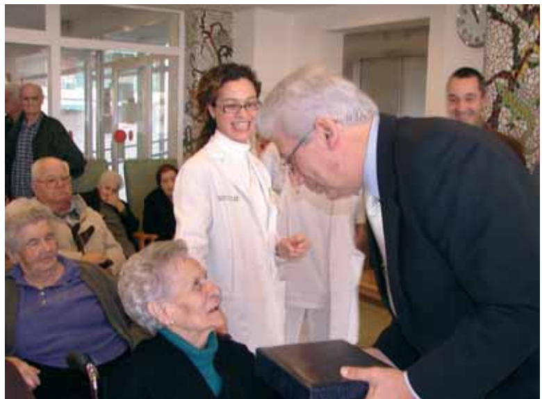
L'Ajuntament felicita una àvia centenària

avis tindran un pati interior per al passeig i el lleure gran i assolellat. L'antiga residència de les Germanes Dominiques es convertirà