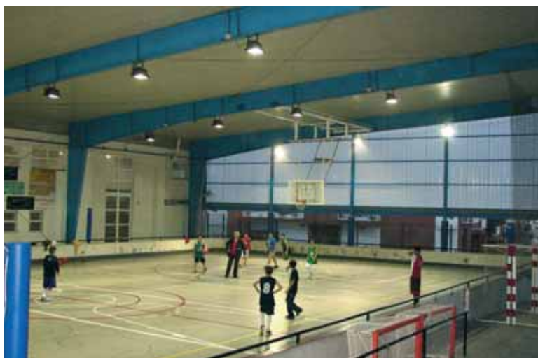
Pavelló d'Esports, pista exterior

Aquests dos equipaments esportius han gaudit tot l'any de les millores que s'hi han anat fent als darrers temps. Al Camp de futbol els vestuaris, el bar, el local social, la farmaciola, un magatzem i ara s'està fent una marquesina. Al Pavelló l'aparcament de bicicletes, parquet i graderies. Avui l'Escola Taller està construint vestuaris i una sala de reunions a la pista exterior petita. A la pista d'hoquei s'hi ha posat una estructura de fibra de vidre per protegir del vent, el fred i la pluja. La Brigada hi ha fet locals per a les entitats.