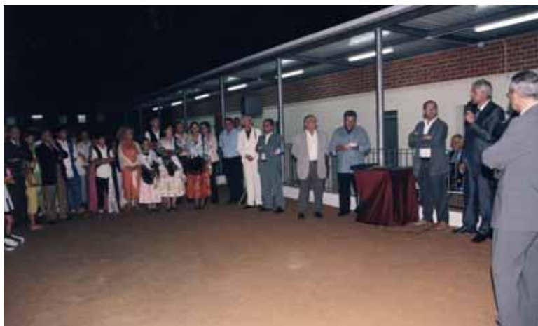
Inauguració dels vestidors del camp de futbol, el setembre de 2004