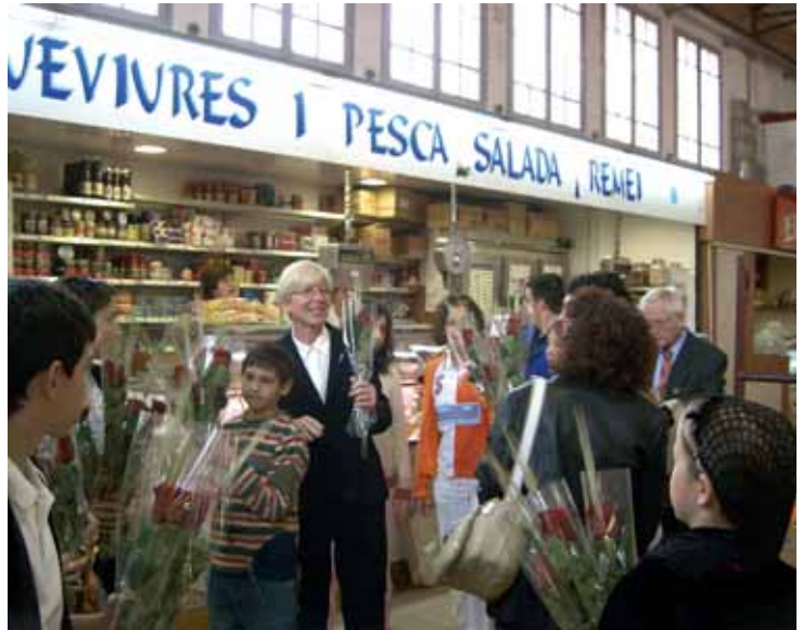
Sant Jordi. Roses a la Plaça Mercat