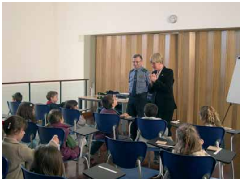
Visita d'escolars a la Comissaria