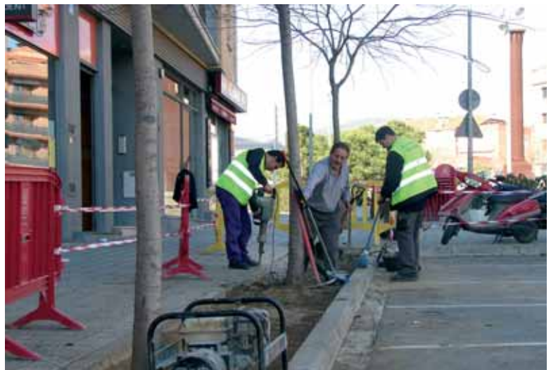
Personal de la Brigada d'Obres i Serveis