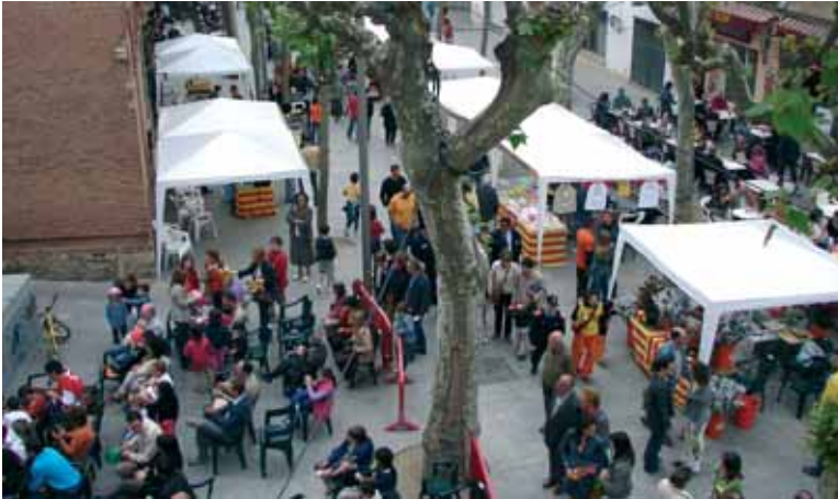
La riera Sant Domènec, inaugurada al 2004, s'ha convertit en un espai de trobada ciutadana

població. L'Odeon ha acabat l'any amb tots els estudis i els projectes aprovats i amb la promesa de l'inici d'obres aquest 2007. Promesa complerta, perquè quan llegiu aquestes ratlles la primera pedra, si no ha caigut ja estarà a punt de fer-ho. Comença doncs, la rehabilitació del vell teatre. El Polígon Can Misser ha vist créixer naus industrials i hi hem pogut veure els primers negocis instal·lats. En aquest espai no tot serà indústria i empresa. Les màquines