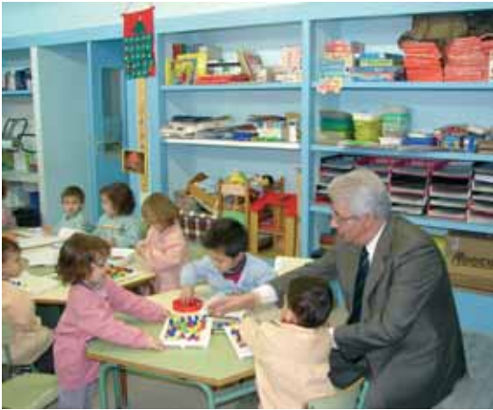
Com cada any, els responsables municipals han visitat les escoles, residències i espais públics del poble per felicitar el Nadal a tothom