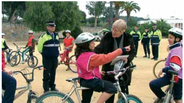
Curs de l'Educació per a la Mobilitat Segura