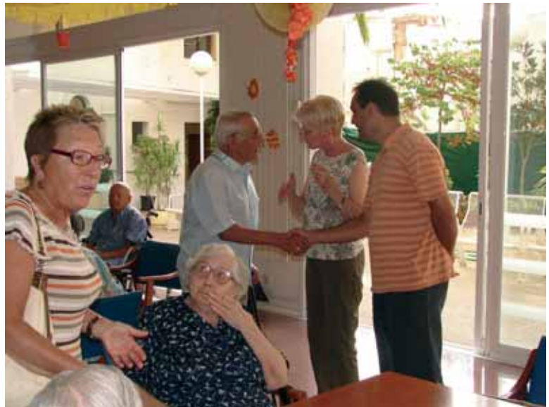
Visita a l'Hospital Residència Guillem Mas, l'agost de 2006

Per ubicar provisionalment el CAP, l'Ajuntament va cedir a l'Institut Català de la Salut els jardins de Vil·la Flora. A l'estiu també va tornar a l'anterior ubicació, mentre no es construïx el nou, al centre del poble. A finals del 2006 coneixíem el nou projecte de millora de l'Hospital residència. Se n'ha de conservar la façana perquè està protegida, però es guanyarà no només en espai, sinó en llum i tranquil·litat, ja que els