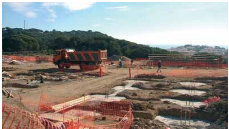
Les obres de la segona escola, avui

Abans d'acabar l'any rebíem la notícia formal, per part del Ministeri de Medi Ambient, de la construcció, a primers del 2007 dels passos subterranis d'accés al passeig Marítim i la platja. I RENFE, per la