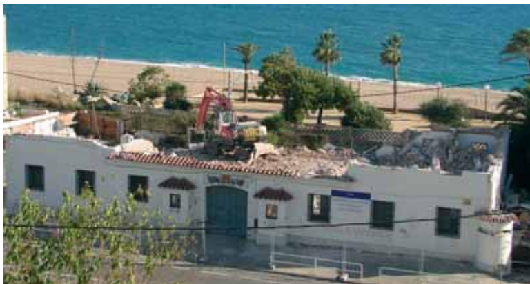
Enderroc de la Caserna de la Guàrdia Civil