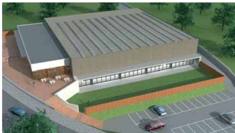
Dibuix de l'exterior de la piscina municipal