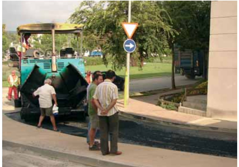
Asfalt de les rondes

I tampoc no podem oblidar-nos d'altres millores que han servit per embellir el nostre poble. Veieu sinó la plaça Busquets o la rotonda entre la ronda Sant Elm i la riera Gavarrà. S'han posat jardineres a la plaça de l'Església i, a finals d'any, es van canviar alguns arbres, que s'havien mort, i se'n van plantar als carrers Bofill i Matas, Tomàs Milans, Dotras Vila i Francesc Cambó. També s'ha ajardinat l'entrada a Canet des de l'autopista.