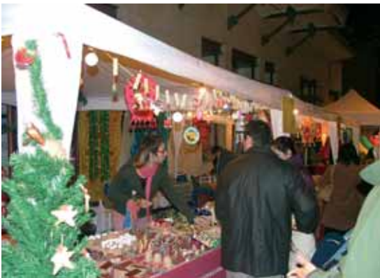
Fira de Santa Llúcia

La imatge escollida per l'Ajuntament per felicitar el Nadal ha estat, aquest 2006, una fotografia de l'Arxiu municipal on veiem l'arribada en barca l'any 1942 de la Mare de Déu de la Misericòrdia. Aquest 2007 se celebren festes jubilaris de la Verge. Farà 100 anys que va tenir lloc la seva coronació canònica i 50 des que és la patrona del Maresme, entre d'altres efemèrides. Ha estat un Nadal farcit d'activitats per a