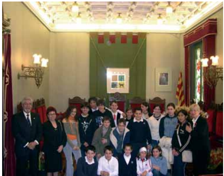
Sant Jordi. Amb les escoles de Canet