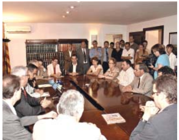
El president de la Diputació i els alcaldes de Canet i Mataró van signar el protocol de reconversió, el 30 de juny passat

a principis d'estiu van signar la Diputació de Barcelona, l'Ajuntament de Canet de Mar i el de Mataró. En aquest protocol s'estableixen els compromisos en matèria de formació universitària, de recerca i transferència de tecnologia i de finançament derivats del procés de reconversió de l'Escola. Amb aquest conveni, l'Escola de Teixits continuarà essent un punt de referència essencial per al sector tèxtil, com ho ha estat al llarg de la seva existència. Els alumnes que encara