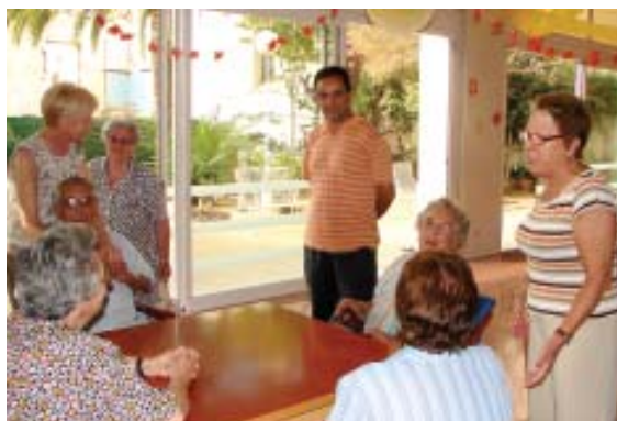
Visita institucional d'aquest agost

Aquest estiu ha tornat la normalitat a l'Hospital residència Guillem Mas. Han estat sis mesos d'obres a l'edifici i d'atur forçós pels treballadors del centre. Els avis, per la seva banda, han estat allotjats en altres residències properes o bé amb les seves famílies.