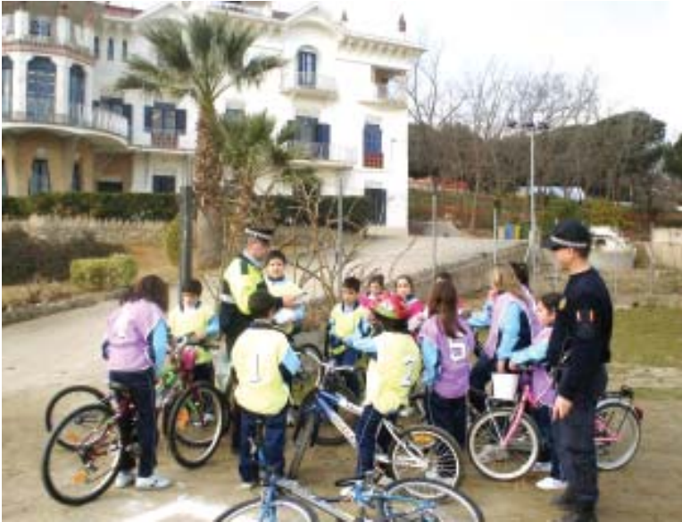
Educació viària. Curs 2004-2005