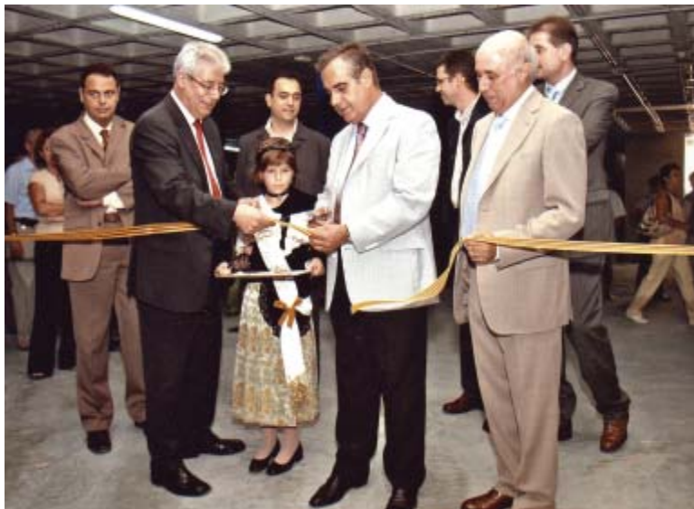
El president de la Diputació, Celestino Corbacho va ser a Canet el 30 de juny per fer la inauguració oficial de l'aparcament

El dia 1 d'agost va entrar en funcionament l'aparcament de la riera Gavarra. Ha estat més d'un any d'obres al centre de Canet. Ara, els titulars de les places i tots aquells que volen deixar-hi els vehicles per una estona, poden fer-ne ús.