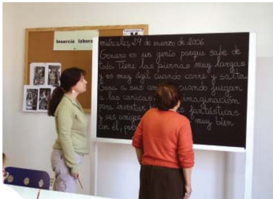
Al curs 2005-2006 hi va haver 120 alumnes estudiant a l'Escola d'Adults

- Llengua viva és una altra novetat que introdueix a l'aprenentatge de la llengua catalana oral i escrita per a