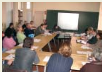
Sessió plenària del Consell municipal de cultura