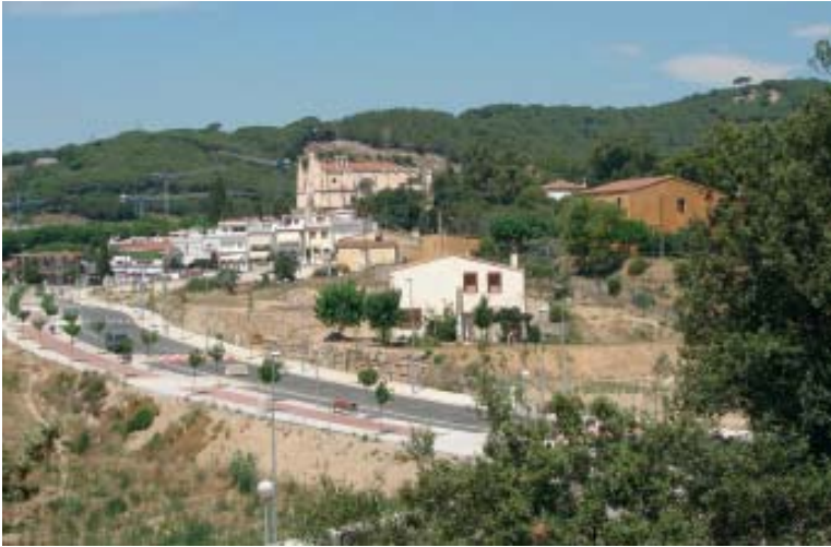
Prolongació de la ronda Dr. Manresa. Juliol 2005