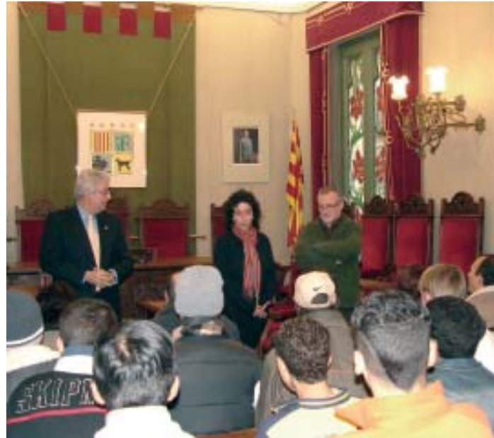
Inauguració de la nova Escola Taller. Desembre 2005

tribuirà a posar fil a l'agulla tant en el pla de millora d'equipaments com en el de serveis. El més interessant d'aquest esforç inversor és que tindrà gairebé un cost zero per als canetencs gràcies a la gestió de l'equip municipal que ha treballat per aconseguir