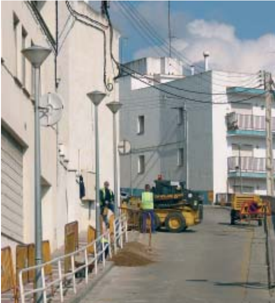
Millors a l'enllumenat públic