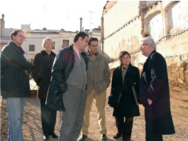
Visita d'obra al futur CAP i aparcament a la riera Gavarra. Desembre 2005