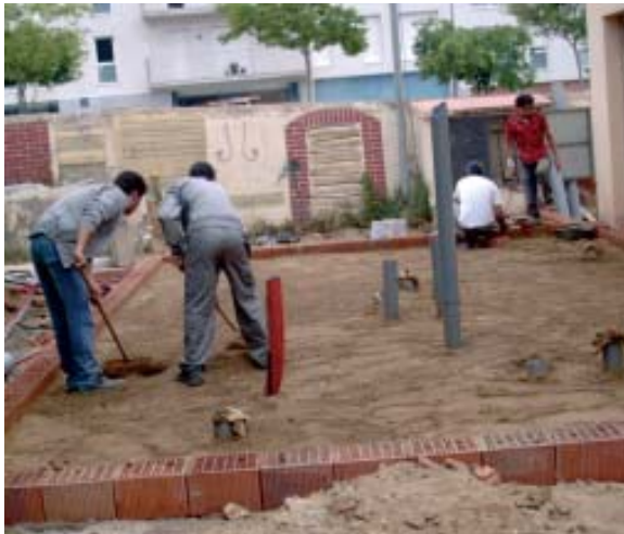
L'anterior Escola Taller va construir els lavabos de l'envelat

El progrés i la recerca d'un bon futur són dos bons propòsits que poden trobar la seva materialització a través de la formació i d'un bon assessorament. Aquest és l'objecte de dos departaments que depenen directament de l'Ajuntament: l'Àrea de Promoció Econòmica i l'Escola Taller.