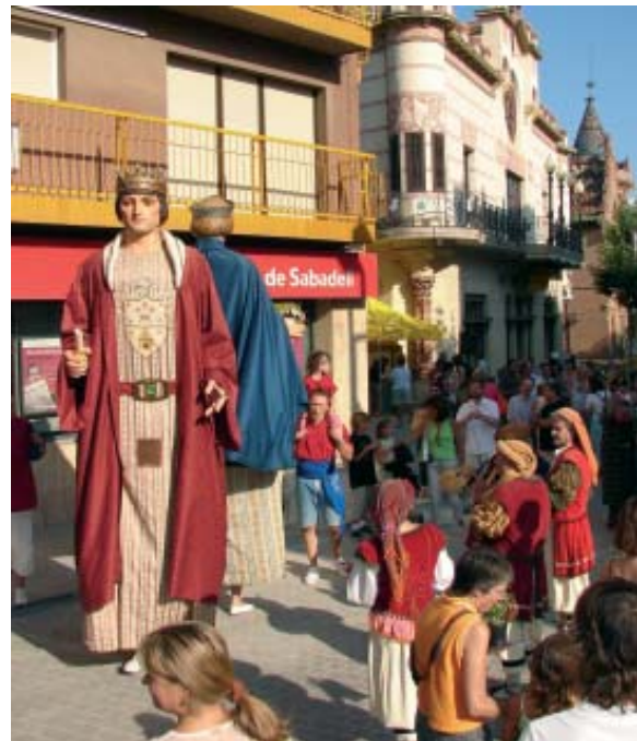
Inauguració riera Buscarons. Estiu 2005