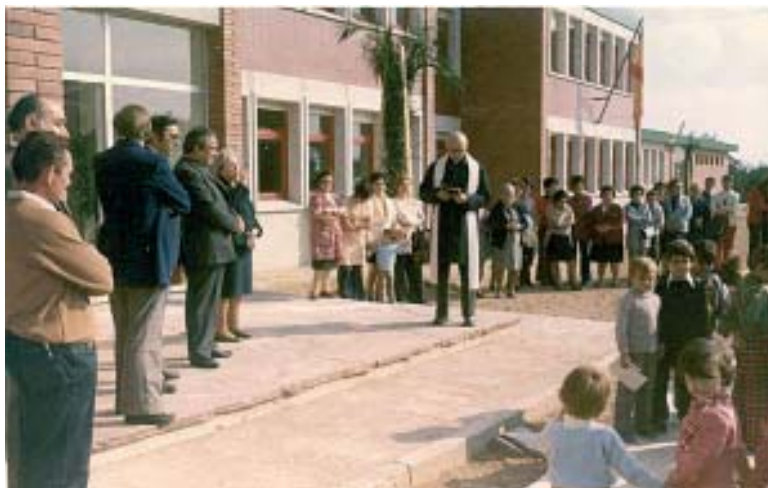
Inauguració de l'escola pública el 1974

L'Àrea de Cultura, en col·laboració amb Ràdio Canet, prepara una exposició sobre la transició a Canet i el naixement de la ràdio al poble.