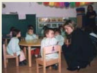
Visita de la consellera l'octubre passat

El darrer Ple municipal ha aprovat les quotes per als diferents serveis. Les mensualitats es mantenen per tercer any consecutiu. Això s'ha pogut fer gràcies a l'augment en les aportacions de les administracions, sobretot de la Generalitat de Catalunya. L'objectiu de la Conselleria d'Educació, d'acord amb el mapa de llars d'infants que han elaborat, és crear 30.000 noves places d'escola bressol abans de l'any 2008, amb l'objectiu d'oferir espai al 30% dels infants de 0 a 3 anys. Canet va inaugurar al 2003 l'escola bressol pública per completar l'oferta de les dues guarderies privades. Avui tenim places per a més del 30% de la població d'aquesta franja d'edat i per això gaudim de l'ajut econòmic màxim de la Generalitat. La subvenció rebuda pel curs 2004-05 és de 126.000 euros. L'Ajuntament vol que els diners rebuts repercuteixin directament en les famílies. Per això és possible mantenir les quotes del servei d'escola bressol. Les úniques quotes que s'apugen són les dels serveis de permanències i de menjador. Tot i així és un augment que està per sota del màxim establert per la Generalitat.