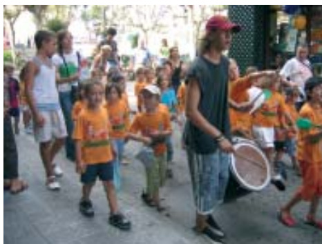
El Plat i Cullera ha celebrat aquest estiu 25 anys

responsables del Palauet van decidir tirar endavant la proposta d'oferir un casal pels nens més petits de tres anys durant l'agost.