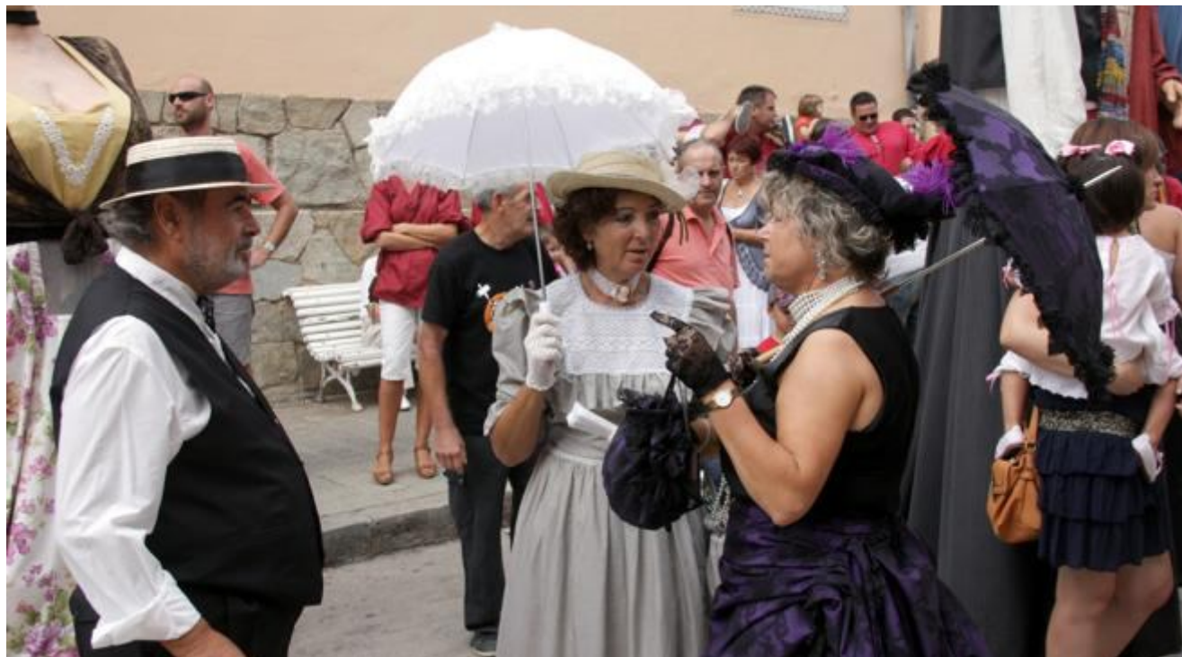
Vecinos de Canet de Mar lucen vestidos de la época del modernismo

Canet de Mar revive este fin de semana la época dorada del modernismo catalán ( http://canetdemar.cat/firamodernista.php ). Por noveno año consecutivo, el pueblo hace un viaje en el tiempo para explicar a los visitantes como era la vida en Catalunya a principios del siglo pasado . Las calles se engalanan y los vecinos y comerciantes lucen vestidos de época. Durante los tres días que dura la Fira Modernista – 16, 17 y 18 de septiembre – hay una muestra de artesanos y de oficios, teatro en la calle, rutas guiadas y espectáculos de todo tipo para todos los públicos.