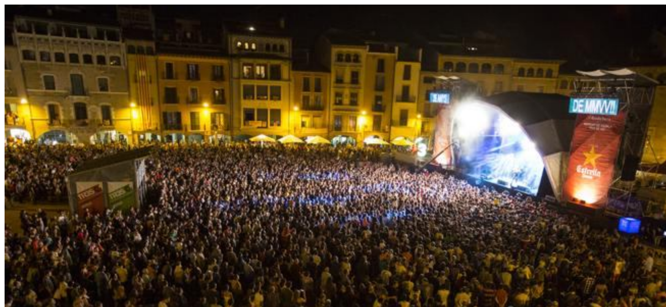
Un concierto de la edición anterior del Mercat de Música Viva de Vic

Este miércoles ha aterrizado en Vic uno de los eventos más especiales de la comarca de Osona, el Mercat Música Viva de Vic ( http://www.lavanguardia.com/musica/20160916/41330118258/vic-mercat-musica-viva-off.html ), que llega para quedarse hasta el 28 de septiembre. El cambio de formato de este año es la principal novedad ( http://www.mmvv.cat/es/ ), que rompe con la dinámica de las últimas ediciones, puesto que toda la actividad profesional y los conciertos del MVLab tienen lugar en el teatro de la Atlàntida y no en el espacio del Sucre como hasta ahora. Las principales apuestas de este año ( http://www.lavanguardia.com/local/osona/20160613/402475921976/mercat-musica-viva-vic-maika-makovski.html ) son las actuaciones de Mayka Makovski , Ara Malikian , Gossos y Alba Molina . A pesar de estos cambios, el certamen mantiene la esencia ya que las dos líneas programáticas del Mercat quedan intactas: el MVLab y el festival de los conciertos en la calle, que harán vibrar una vez más a todos los asistentes.