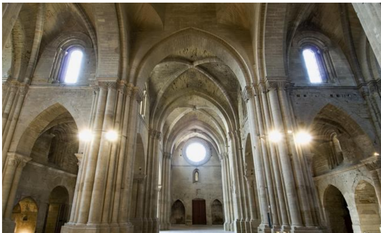
Interior de la Seu Vella de Lleida

Cada año Europa dedica un fin de semana a dar a conocer edificios históricos, museos y monumentos de todo el continente. En Catalunya , la edición de este año tiene lugar los días 16, 17 y 18 de septiembre y está dedicada a las personas que trabajan por el conocimiento, la difusión y la conservación del patrimonio . Bajo el eslogan Patrimoni de tot@s , se han organizado un seguido de actividades gratuitas para todos los públicos ( http://patrimoni.gencat.cat/ca/jep2016 ): visitas guiadas,