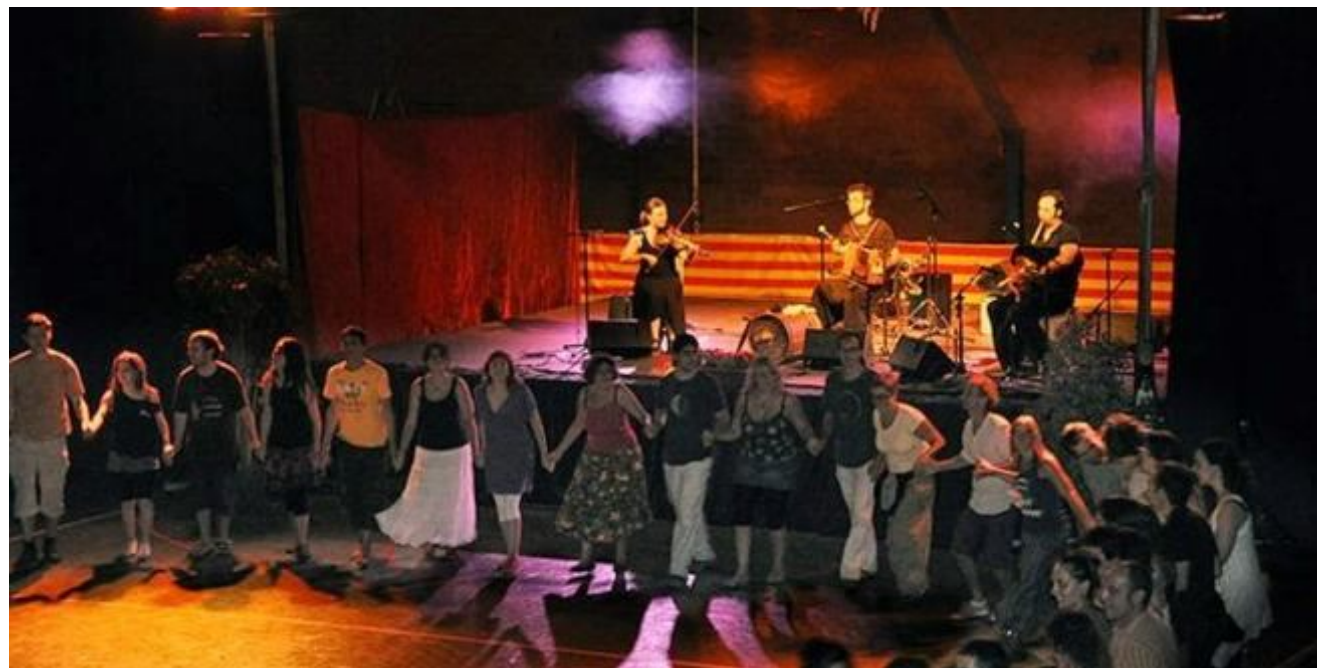
Imagen de la tercera edición del Berguedà Folk

Este fin de semana, el municipio de Puig-reig se convierte en la capital de la música y la danza de raíz tradicional. La octava edición del Berguedà Folk acoge en el Alberg de la Colònia Cal Pons de Puig-reig una veintena de actividades alrededor de la música folk. Entre las novedades de esta edición ( http://www.lavanguardia.com/local/bergueda/20160914/41299576118/bergueda-folk-puig-reig-musica-danza-tradicional.html ), destaca un número superior de talleres y actividades gratuitas como el taller de iniciación al baile folk, el taller familiar de baile folk, el taller de construcción de instrumentos y las sesiones matinales de yoga. Durante los tres días que dura el certamen –del 16 al 18 de septiembre– están programados una decena de actuaciones ( http://www.berguedafolk.cat/ ) de grupos musicales como Farigola Trad ,