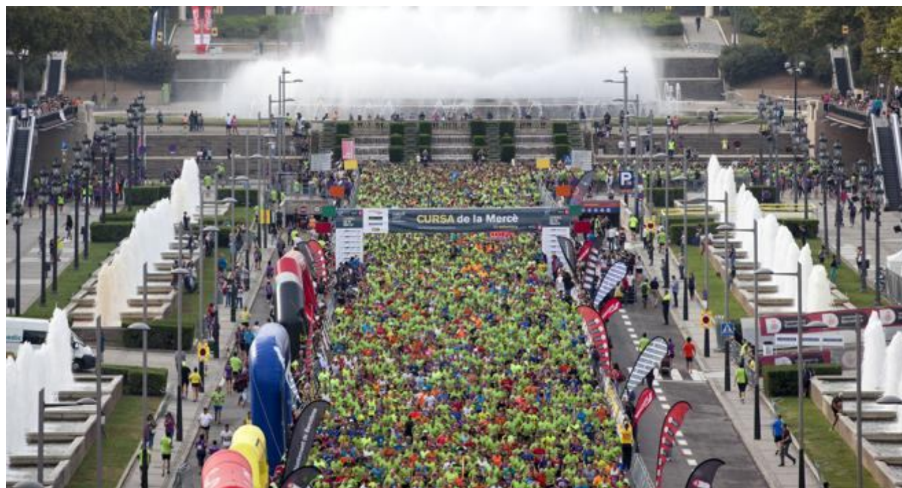
La salida de corredores de ediciones anteriores de la Cursa de la Mercè (Mané Espinosa)

La Cursa de la Mercè se ha convertido en un clásico en Barcelona . Un año más la capital catalana aprovecha la festividad de la Mercè -24 de septiembre- para llenar sus calles de runners . El circuito escogido para esta 37. a edición consta de 10 kilómetros de distancia y empieza y finaliza en la Avinguda de la Reina Maria Cristina .