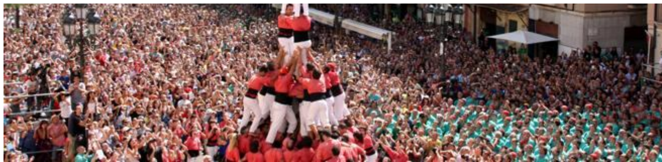
Los castellers son una de las actividades más conmemorativas de las fiestas de Santa Tecla de Tarragona

El día 23 de septiembre está totalmente marcado en el calendario de todos los tarraconenses. Tarragona celebra la Diada de Santa Tecla y aunque la festividad es el día 23, durante diez días – del 15 al 24 de septiembre – tienen lugar un seguido de celebraciones festivas que han hecho de este acontecimiento uno de los más singulares y participativos de Catalunya. En motivo de la patrona de la ciudad, se prepara un programa de actos ( https://www.tarragona.cat/cultura/festes-i-cultura-popular/santa-tecla/santa-tecla-ca ) que acoge espectáculos de artistas conocidos venidos de todo el mundo y actividades promovidas por los vecinos de la ciudad. Aunque el programa varía año tras año, se estructura siempre a partir de unas actividades que se mantienen fijas en cada edición y que configuran la secuencia ritual de las fiestas. Actividades tan tradicionales como procesiones, castellers , el Ball de Diables , el Drac , el Bou , la Víbria , el Ball de les Gitanes y muchísimos más elementos musicales y folclóricos que convierten Tarragona en un plan imprescindible para muchos este fin de semana.